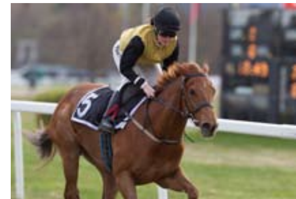
Galla Placidia vant lekende lett siste start.