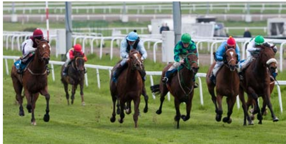
Feltet i Øvrevoll Mile Cup 2009, der Half Pint Bill vant.

Øvrevoll Mile Cup er et populært løp for de hestene som befinner seg rett under den ypperste eliten. Kampen om å komme med i feltet er knallhard, for her er det mer penger å kjempe om enn disse normalt har. De 15 som er kvalifisert, vil ganske sikkert levere et spennende og severdig løp. Det pleier å være jevnt, slik det var i fjor da Half Pint Bill spurtet som en demon og knep seieren på streken. Da var det mindre enn fem lengder ned til niendehesten i mål, slik vi ønsker at galoppløp skal være. Half Pint Bill hadde for øvrig