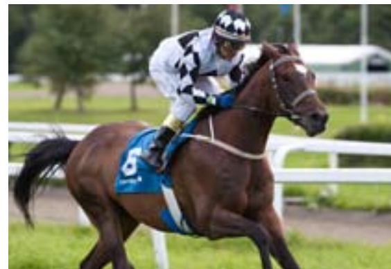
Heureux starter i Øvrevoll Mile Cup.