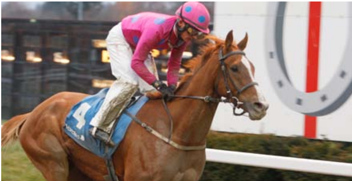
Artie Bucco vant for Stall Trick Or Treat.