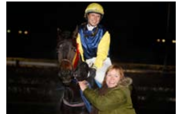
Delily vant sist fredag og starter igjen i dagens 4. løp.