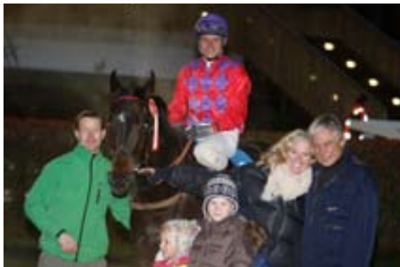
Pilgrim vant Noviseløpet.