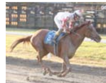
Until June har vunnet sine to siste starter.

De to siste løpsdagene har Chicken Momo og Touch of Hawk vært gode holdepunkter. Denne gang er det ingen favoritt som skiller seg så klart ut. Noen av de mest betrodde som viser form, kommer sikkert til å vinne. Det kan bli en hyggelig V5, men kanskje ikke noen topputbetaling?