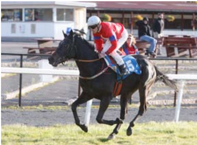
Touch Of Hawk cantret inn til seier i Norsk St Leger.