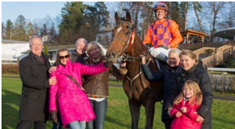
Ragazzo ble Norges Mester for 3-åringene.

Ragazzo og Dickie Dickens ble gode norgesmestere på Øvrevoll fredag. Aller mest imponert ble vi over Ragazzo blant treåringene. Cassano gikk et bra løp, men ble kontant avvist.