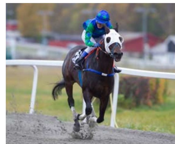
.... det gjør også Rapponghi som er programmets favoritt i løpet.