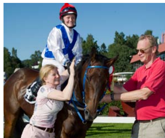
Otama Obama har besøkt Øvrevolls vinnerpaddock fire ganger i år, han starter i Dagbladet Løp i dag...