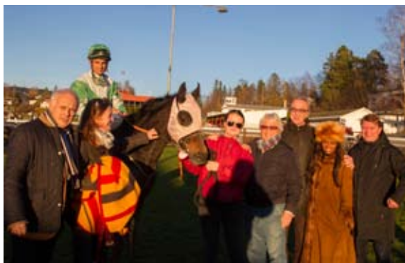
Female Spring tok sin tredje seier for året.