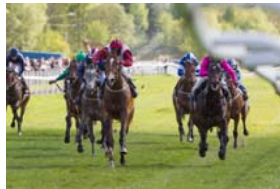
Favorittene i dagens hovedløp blir Messi....

Hele 14 norskoppdrettede treåringer setter hverandre stevne i Brukseier Eyvind Lyches Minneløp torsdag. Et flott felt og veldig positivt nå som det ser ut til å være tynt blant den litt eldre norske garde. Løpet har vært en blanding av favoritter og outsiders i vinnerpaddocken etter dette anerike løpet, oppkalt etter en av de store ildsjelene i banens yngre dager. Mange favoritter har falt fordi de ikke har stått den krevende distansen 1980 meter. Vi likte Messi så godt i årsdebuten, at vi velger å sette ham først på tipslinjen. Også for ham gjelder det å takle ny distanse, men vi tror det skal gå bra. Kun tre starter har Messi så langt, så her tror vi på fremgang.