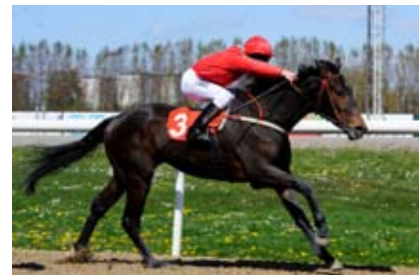
.... og Cassano.

høydepunktene. Derfor følte jeg at han trengte et løp på forhånd. Får bare håpe at han fungerer fint i trening frem til torsdag. Fellet er lite, men veldig bra. Men en gang må vi jo komme i gang, beretter trener Are Hyldmo. Heller ikke denne gang ser V5-rebusen ut til å bli enkel. Likevel tror vi på litt større sjans til å løse en del av løpene uten å bruke alt for mange streker. I V5-avdelingene to og tre er det meget gode hester på startstreken. For den del av publikum som setter pris på god sport, er dette to løp å glede seg til. Rask galopp i det grønne er en estetisk nytelse, synes vi. Stor sport er god underholdning, og vi gleder oss til den siste maikvelden på Øvrevoll.