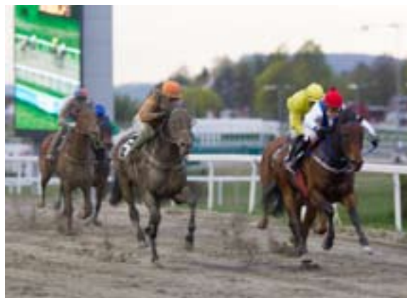
Det ble dødt løp i V5 finalen mellom Azincourt og Otama Obama.