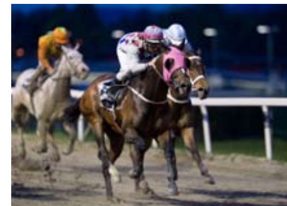
Home Straight kan ta årets 3. seier i dag.