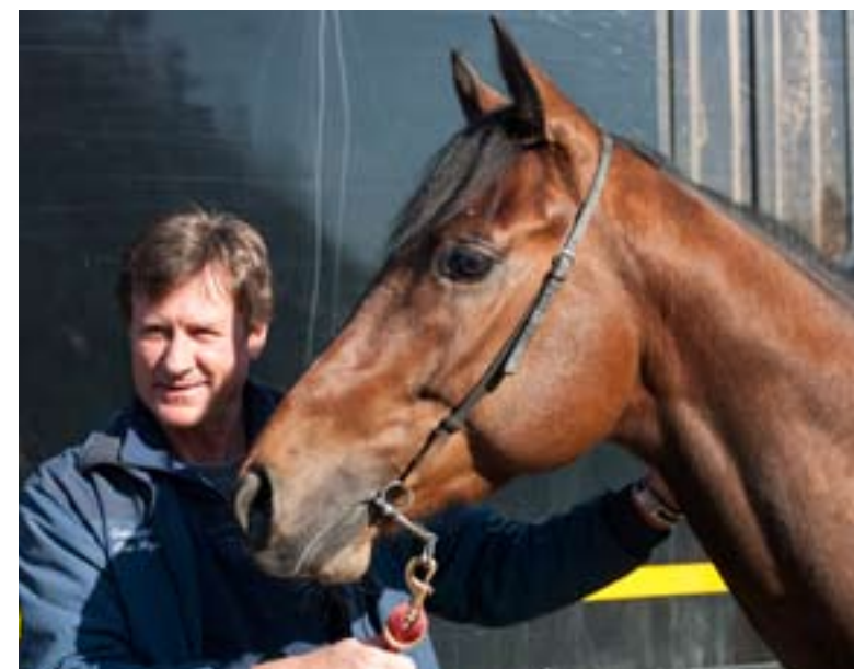
Are Hyldmo med Folkehesten Øvrevoll, Holiday Reading.

Ofte på de første løpsdagene kommer det hester til start med