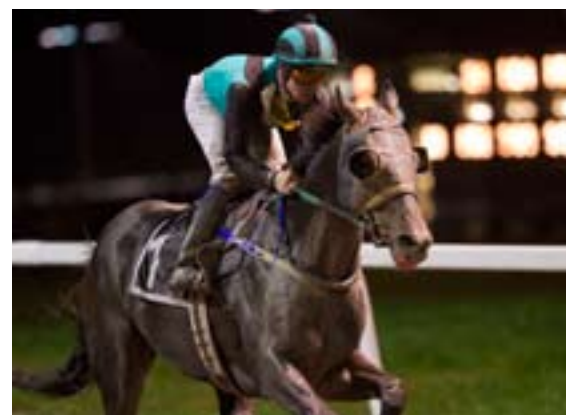
Equito Hill vant en ny overlegen seier sist torsdag, i kveld starter han i det 7. løpet.