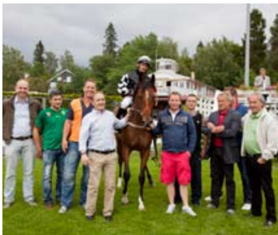
Super Sub med glade eiere i vinnerpaddocken

Da er det bare å ønske vel møtt til en flott løpsdag. Det er to V5-spill og mange muligheter til å sikre et lite overskudd.