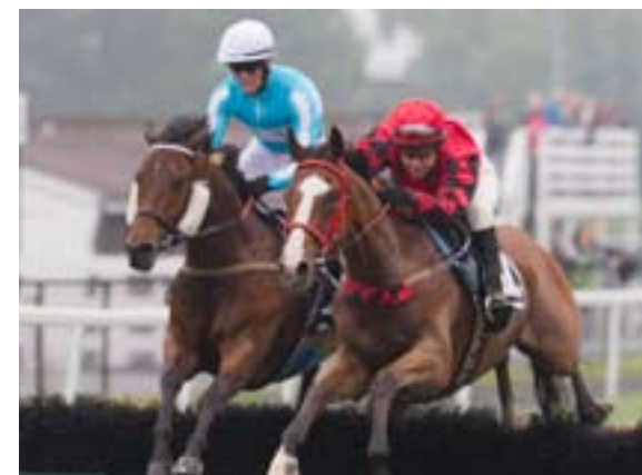
Nosferatu vant hekkeløpet 9. juni foran Monfalcone.