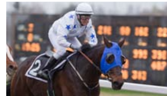
Cool Match vant 21. april.