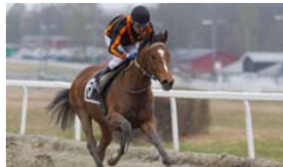
Dubai Samurai vant 21. april.

Allerede nå gjør vi oppmerksom på at løpsdagen i neste uke, er onsdagsløp i lunsjen. Første start onsdag 11. april er kl. 12.15, og det er ikke løp neste torsdag på kvelden. Derimot blir det løp både tirsdag (17. mai) og torsdag (19. mai) i den påfølgende uke.