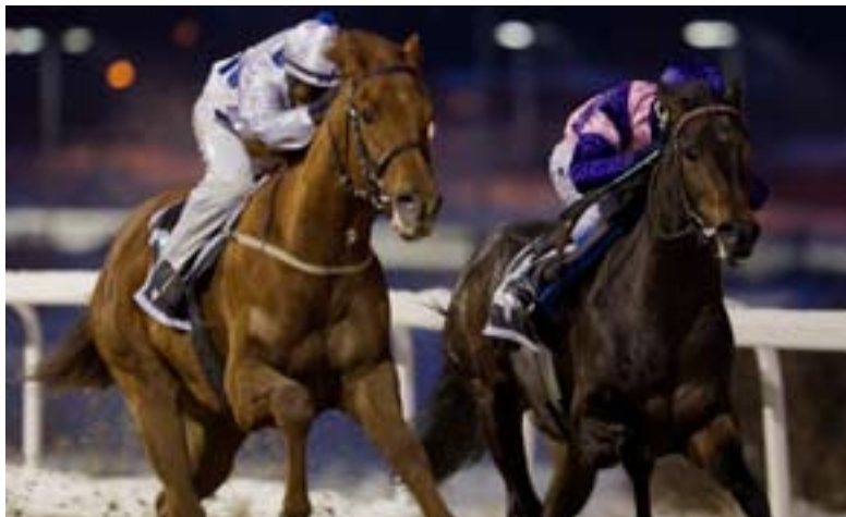
Fabelaktig debut av Fabian i toårsløpet.

På årets nest siste løpsdag fikk vi servert en flott debut. Toårige Fabian kom frem til ledende Wings of Thunder før siste sving og tok seg forbi på oppløpet. Tredje ble Arn, også en spennende debutant.