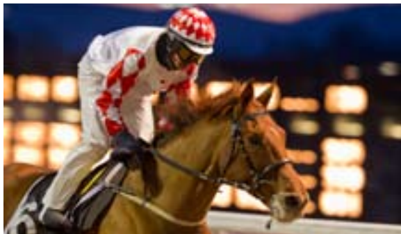
Until June gikk et nytt fint løp i høstmørket.

Cicinho vant V5-finalen, og dermed ble det ingen dobbeltvinnere. Alle de tre i toppen av jockeylisten tok hver sin seier, og dermed er det status quo blant disse. Vi gratulerer Øvrevoll Hesteeierforening, som hadde et meget sterkt V5-forslag til bare 100 kroners innsats.