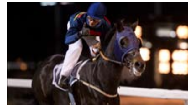
Big Master vant sist fredag og starter igjen i dagens 7. løp.