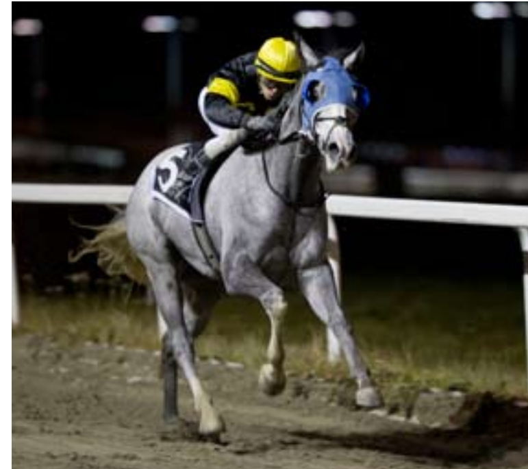
Ketchikan er programmets bankerforslag denne uken.