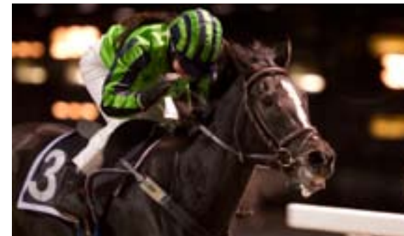
Cicinho vant sist fredag og starter igjen i dagens 5. løp