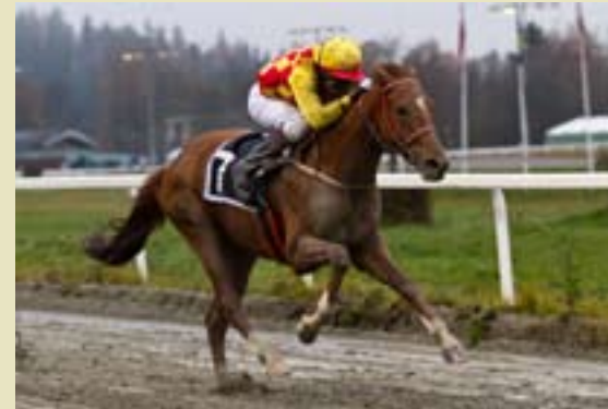
Apilado vant toårsløpet.