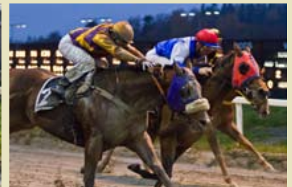
Phili Boy vant med nese foran Face The Fact.