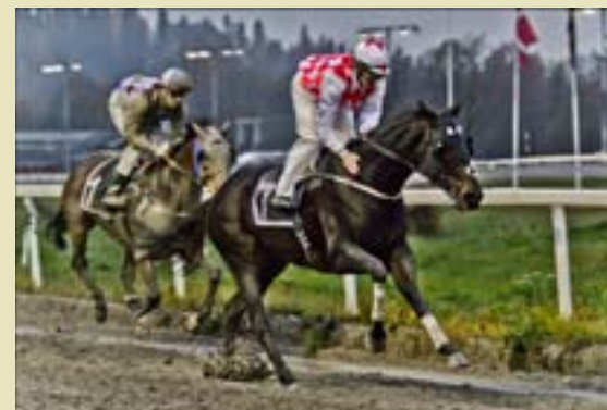
Harmony Hall tok en enkel seier i Noviseløpet.