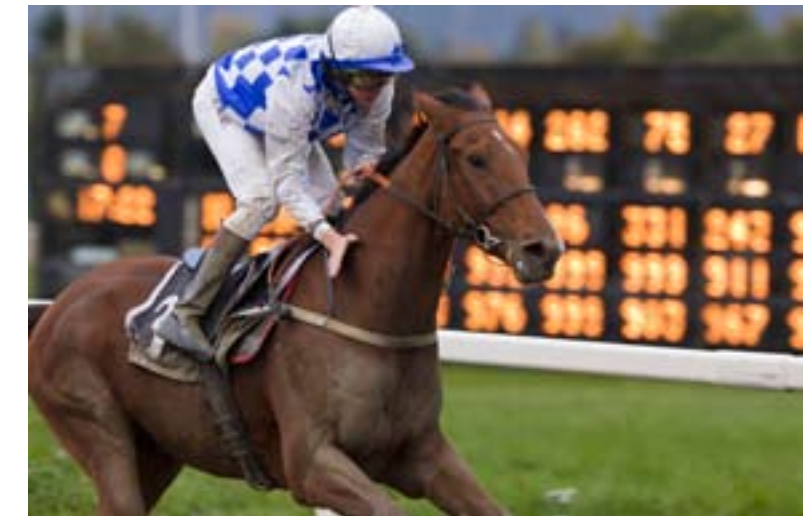
Tiger For Two vant sist fredag og er programmets bankerforslag.

Spillemessig prøver vi med Tiger for Two som banker. Han gikk et sterkt løp sist fredag, og tillegget på to kilo gjelder ikke før neste gang. Det er gode treåringer i mot, men V5-spillet er så vrient at vi lar det stå til. Før V5 tar til får vi to løp for toåringene. De norskoppdrettede kjemper om det flotte vandresverdet. Motstanderne jubler over at Poppi har tatt vinterhvile, for da er en seier innen rekkevidde. Royal Games og Favoritten blir våre favoritter, men de øvrige vil sikkert være med i kampen om sverdet.