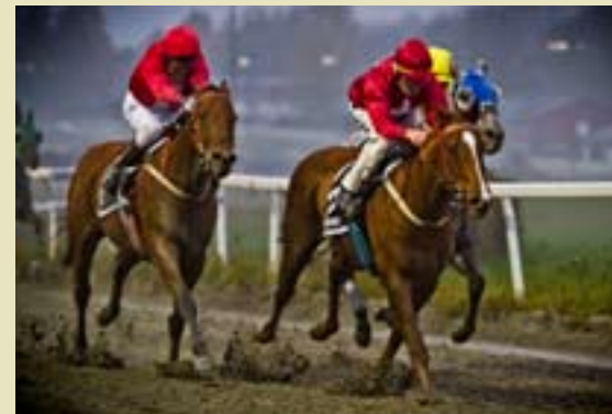
Red Colori vant foran stallkameraten Simian.