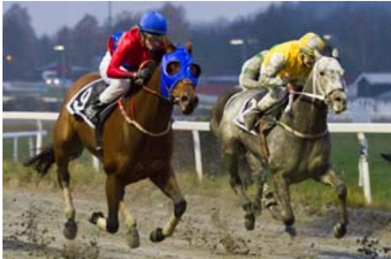
Wattan tok sin fjerde strake seier!