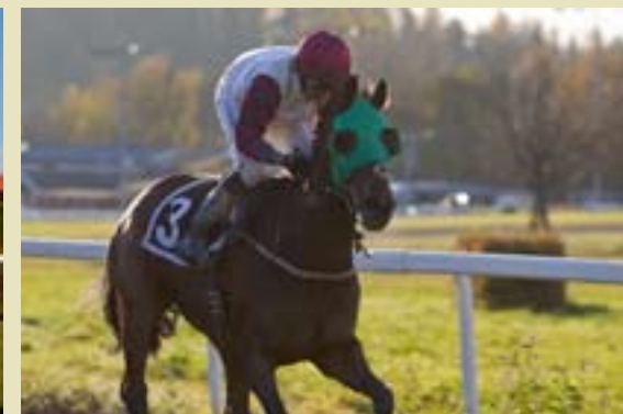
Northern Pal vant sin andre strake seier.