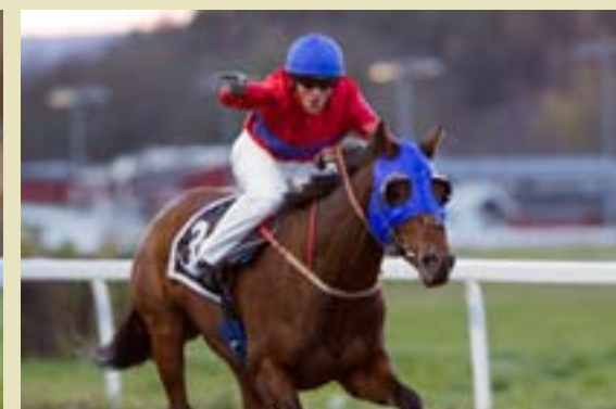
...mens Wattan tok sin femte!