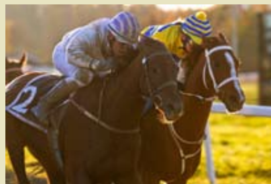
Timtaya vant i hard kamp mot Artistic Light.