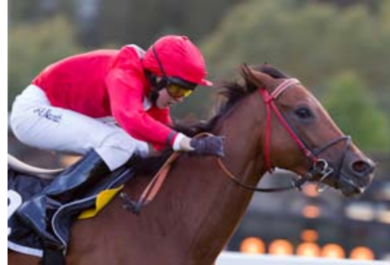
Simian er programmets favoritt i det 3. løpet.