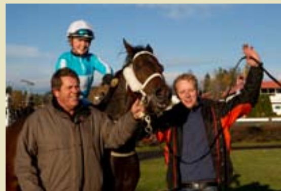
Monfalcone vant Novisehekkfinalen.