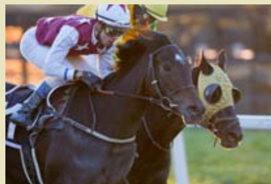
...Richelle tok sin tredje seier for året...