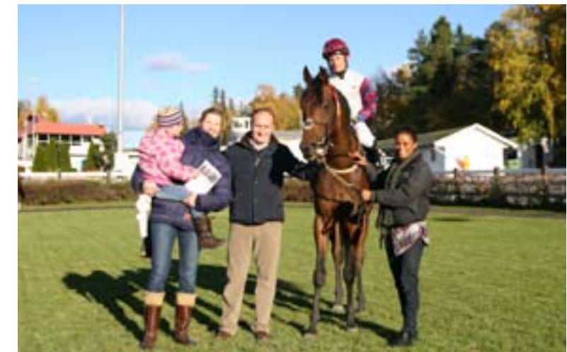
Northern Pal har besøkt vinnerpaddocken to uker på rad, blir det den tredje?