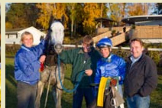
Fighting Spirit tok årets første seier...