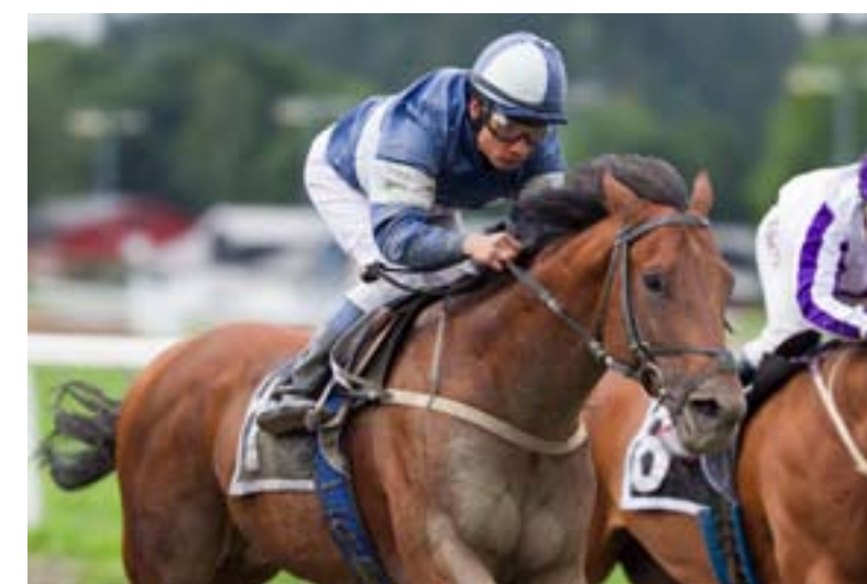
Caerus er programmets banker.