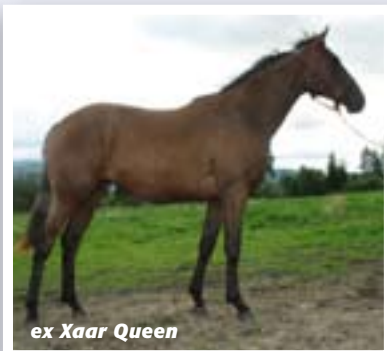
ex Xaar Queen