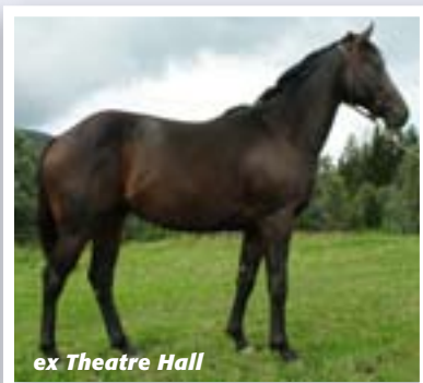
ex Theatre Hall