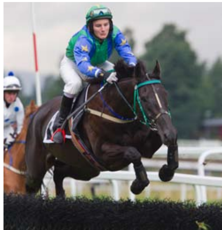
Carius er ubeseiret over hinder.

Den flotte Derbydagen er for lengst historie, og når vi beveger oss mot Øvrevoll torsdag, skriver vi september. Det er løp på gressbanen så sent som kl 20.20, og det går sikkert bra. Men på kveldstid er det nok smart å legge gressløpene tidligere allerede i neste uke. September er nemlig den måneden hvor døgnet forkortes mest. Bli det dårlig vær da, er det rett og slett ikke særlig lyst litt utpå kvelden.