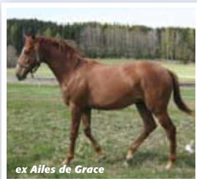
ex Ailes de Grace