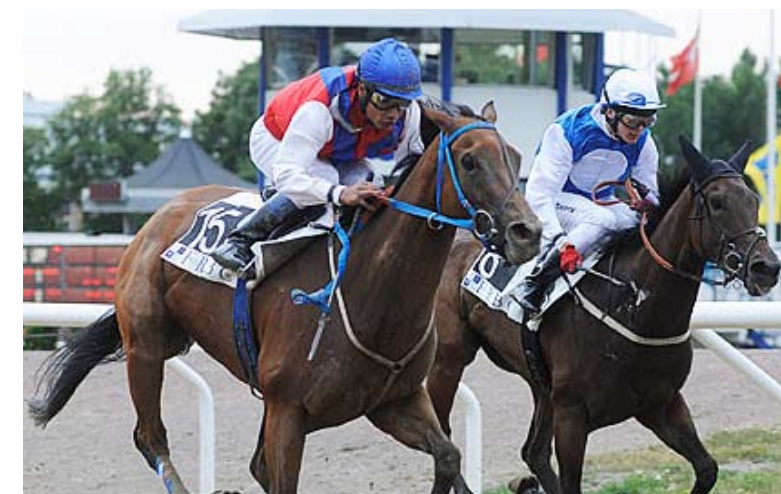
Wellness ble nr to i Svenskt Oaks lørdag 24. juli.