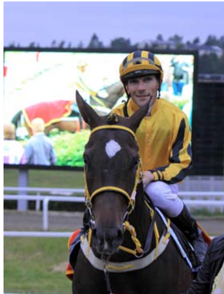
Får Symbol Of Arch besøke vinnerpaddocken igjen i kveld?