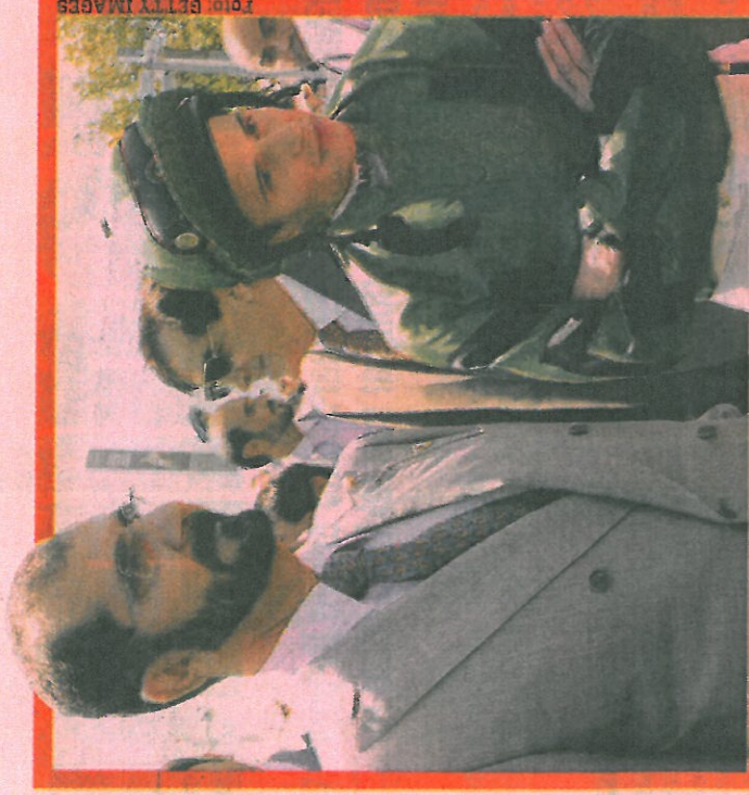
SJEF, SJEIK & STATSMINISTER: Her står William Buick sammen med sin nye sjef, Sjeik Mohammed Al Maktoum, som også er statsminister i De forente arabiske emirater.